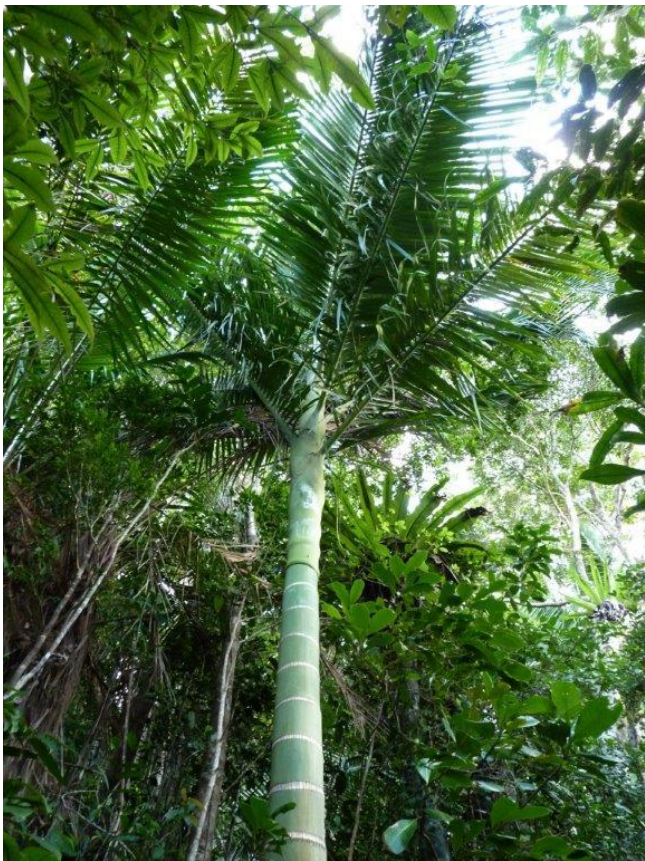
Dypsis Hovomanntsira CR