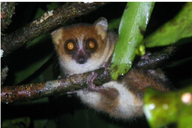
Microcebus simmonsii EN