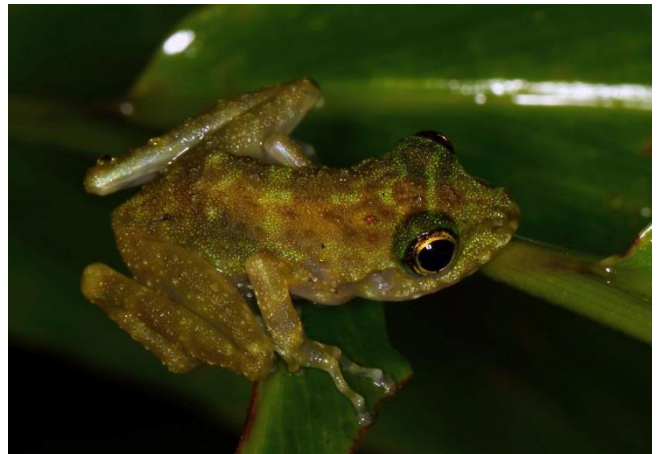
Gephyromantis webbi EN