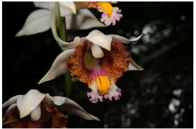
Gastorchis Tuberculosa EN