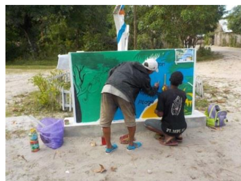
Panneau en cours de réalisation par les artistes Naivo et Elysée