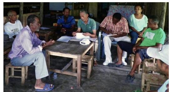
Réunion de concertation

Consultation du cadastre pour information et vérification