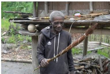
Utilisation domestique de l'inflorescence de Dypsis fibrosa comme balai à Vakivilany.

Le Dr Verohanitra Rafidison , propose un travail ethnobotanique sur l'utilisation des palmiers par les villageois (usages culinaire, médicinal, domestique et culturel). Cette recherche a pour but de comprendre les savoirs traditionnels en terme d'exploitation locale des palmiers par les populations autochtones comme produits forestiers non-ligneux. Les résultats permettront de trouver les mesures à adopter pour la conservation des espèces menacées d'extinction, et de proposer aux personnes dépendantes de ces produits les solutions alternatives pour un développement durable.