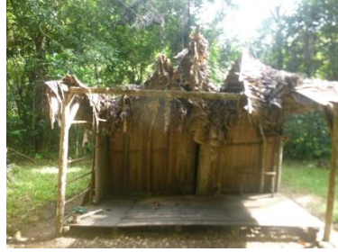
Etat du bungalow après AVA

Le bungalow commun qui abritait le bureau et le restaurant a été très fortement endommagé par le cyclone AVA.