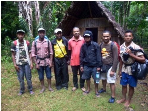
AGPN et une équipe de Madagasikara Voakajy à Ambodiriana - Octobre 2017

Comme annoncé dans le bulletin N° 1, une équipe de Madagasikara Voakajy est venue en octobre 2017 pour faire une étude préliminaire de faisabilité de création d'une Aire Protégée .