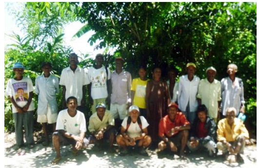
Les membres de l'association TSIMALONJAFY

En échange, ils demandent que leurs droits coutumiers soient reconnus, à être associés au processus de création et à la gestion de l'aire protégée. Ils souhaitent également recevoir un pourcentage sur les recettes de l'excursion en pirogue sur le fleuve puisque son intérêt touristique vient de la bonne conservation des berges.