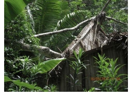
Dégâts au plus grand bungalow

Les deux plus grands bungalows ont reçu un arbre en travers du toit et la cuisine a perdu ses murs.