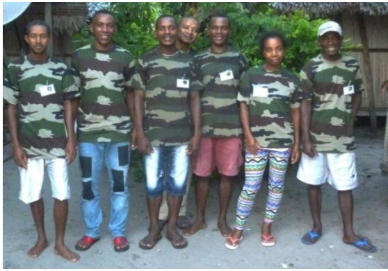
AGPN en mode commando

Pour résoudre le problème des infractions commises, ils ont demandé un appareil photo.