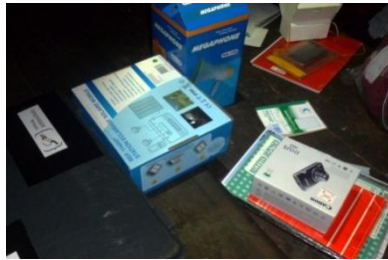
Des outils de surveillance performants

Pour résoudre le problème des infractions commises, ils ont demandé un appareil photo.