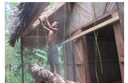
L'AGPN au travail