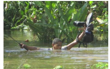
Le sentier vers Ambodiriana après ENAWO

L'autre enseignement, c'est qu' Albizia gumifera , cité comme arbre pionnier dans les reboisements, est fragile au vent et n'est pas conseillé dans cette région.