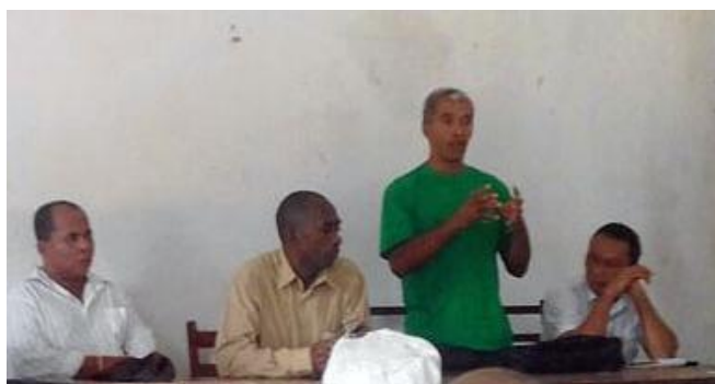
Rencontre à Manompana

Après avoir visité la forêt et rencontré les villageois, il a écrit dans son rapport : « Site quasiment intact, approprié pour la recherche scientifique, site touristique attrayant, volonté des populations de s'intégrer dans le système de transfert de gestion des ressources naturelles. »