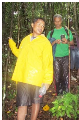
< L'administration forestière à Ambodiriana

Après avoir visité la forêt et rencontré les villageois, il a écrit dans son rapport : « Site quasiment intact, approprié pour la recherche scientifique, site touristique attrayant, volonté des populations de s'intégrer dans le système de transfert de gestion des ressources naturelles. »