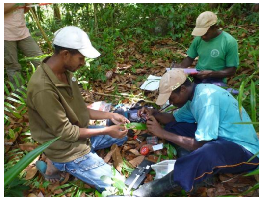
L'équipe en formation

Ils pourront ensuite partager leurs connaissances auprès des villageois et des touristes et devenir acteurs pour sensibiliser le plus de personnes possible à la nécessité de préserver toute la biodiversité de la forêt.