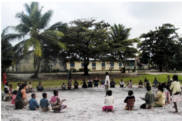
Sensibilisation par une bénévole.

Sur place, après avoir contribué à la formation des enseignants, ceux-ci et les guides d'AGPN pourraient animer le club en répondant aux besoins des jeunes.